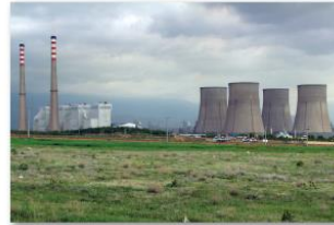
محطات الطاقة الحرارية