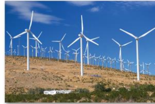
محطات طاقة الرياح